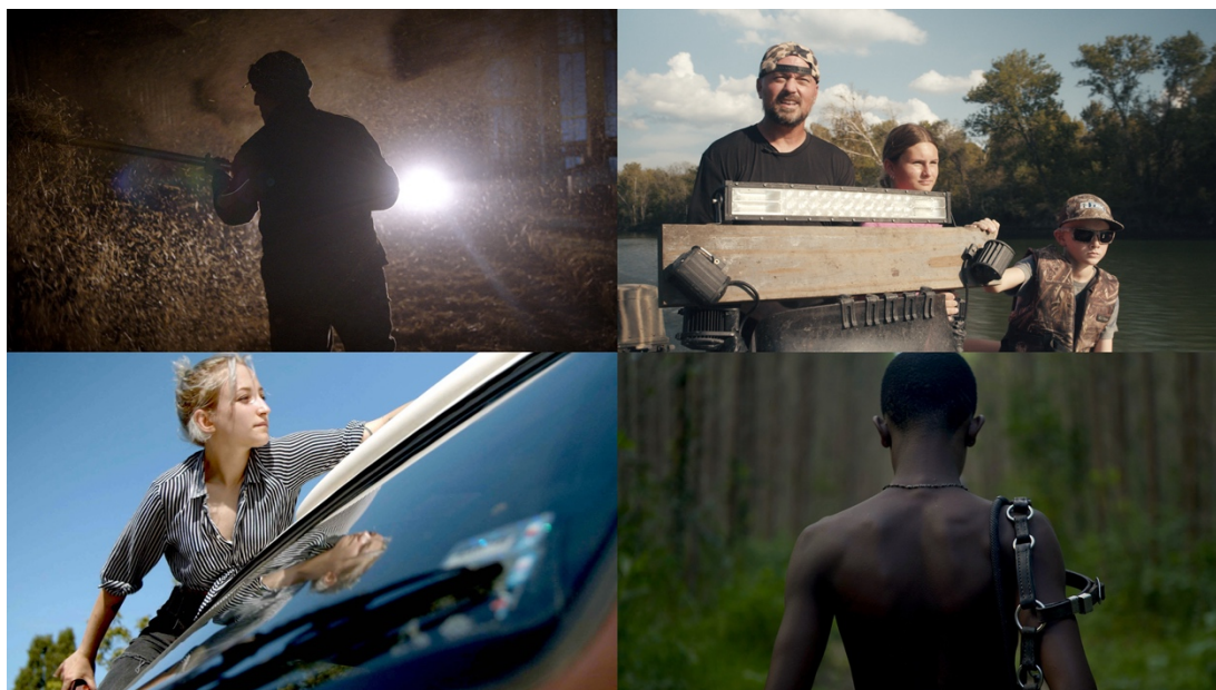
© Tale of Baba, Road 190, Songs of Sisterhood, Helvécia

Quatre projets audacieux seront présentés au Festival de Cannes 2024 lors du Showcase exclusif Docs-In-Progress, représentant des voix établies et émergentes du cinéma suisse contemporain.